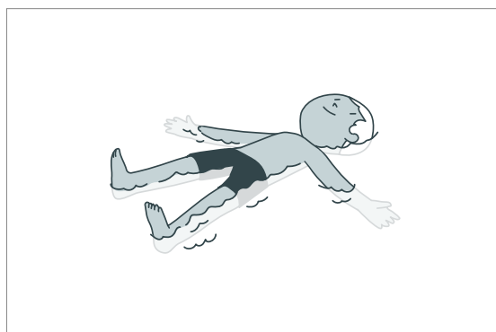
Manter-se a flutuar no lugar durante 1 minuto