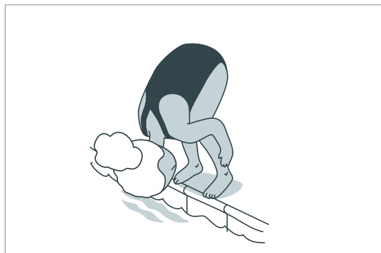
Mergulhar em cambalhota da borda para a água profunda

Se a sua criança não for aprovada, informe-se sobre os locais onde poderá praticar para o WSC e repeti-lo. Encontrará escolas de natação que oferecem cursos para o WSC em swimsports.ch e swiss-aquatics.ch .