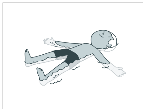
Se maintenir sur place à la surface de l'eau pendant une minute.