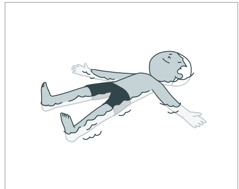
Sich 1 Minute an Ort über Wasser halten