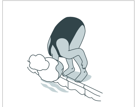
Rolle/purzeln vom Rand in tiefes Wasser

Ihr Kind muss noch mehr trainieren. Suchen Sie Adressen von Schwimmschulen mit einem WSC-Kurs. Sie finden Hilfe im Internet auf: swimsports.ch und swiss-aquatics.ch .